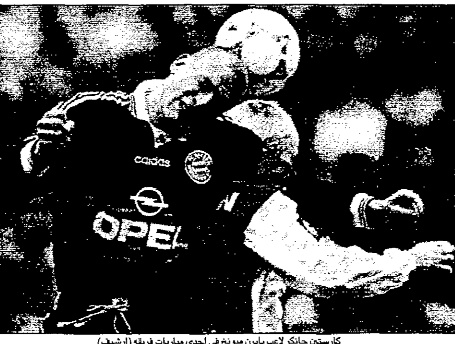
كارسين جانكر لاعب بايرن ميونخ في إحدى مباريات فريقه

ساو باولو (البرازيل) - اف ب: عاد مهاجم كرة القدم البرازيلي الدولي ادموندو الى فيورنتينا الايطالي لمعاودة اللعب مع فريقه الذي تركه منذ نحو شهر على أمل اعادة ضمه الى صفوف المنتخب للمشاركة في مونديال 1998. وكان ادموندو ترك فيورنتينا الشهر الماضي لرفضه اللعب احتياطيًا. وذكر ان وجوده على مقاعد الاحتياطيين يعني انه غير مؤهل للانضمام الى المنتخب بلاده. وقال ادموندو قبل مغادرته ريو دي جانيرو: ووضعني حرج كل الفريق سوء حاله. ويغيب عن صفوف فيورنتينا الدوليان الاجنبي اللوقوف غابرييل باتيستوتا والبلجيكي المصاب اوليفيرا. واضاف ادموندو: اللهم ان اللعب لاجل مكاني في المنتخب. وذكر بعرضه فينيسيوتو وكل ادموندو ان فيورنتينا لن يرفض اي دعوة على اللاعب.